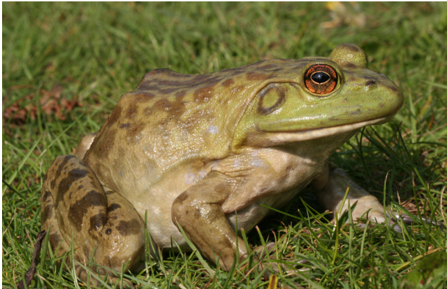
Amerikaanse stierkikker.