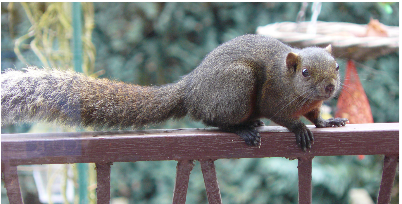
Pallas' eekhoorn.

Een voorbeeld is het wegvangen van de Pallas' eekhoorn in een gebied van 18.000 hectare bij Weert. In totaal werden daar 249 dieren gevangen. Dit duurde vier jaar en kostte naar schatting € 300.000,-. De kosten gingen vooral zitten in de arbeidsintensieve controles of alle dieren daadwerkelijk weg waren; kosten voor opvang van de dieren zijn niet inbegrepen. Daarmee is het een geslaagde actie, omdat ingegrepen is toen het nog haalbaar was om alle dieren te verwijderen. Wel waren de kosten beduidend lager geweest bij eerder ingrijpen. Echter, wanneer later wordt ingegrepen zullen de kosten verder oplopen, zoals bij de bestrijding van de muskusrat. In 2017 zijn er in Nederland 61.859 muskusratten gedood via klemmen en verdrinkingskooien. Dit vergde 360.659 uren en kostte de waterschappen 34 miljoen euro.